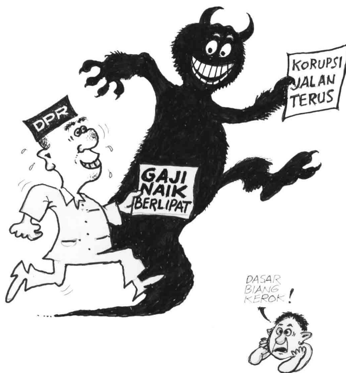
Karikatur: Gambar sindiran atau kritikan yang bernuansa humor

James Danandjaya (dalam Suhadi, 1989), mengatakan sebagai berikut.