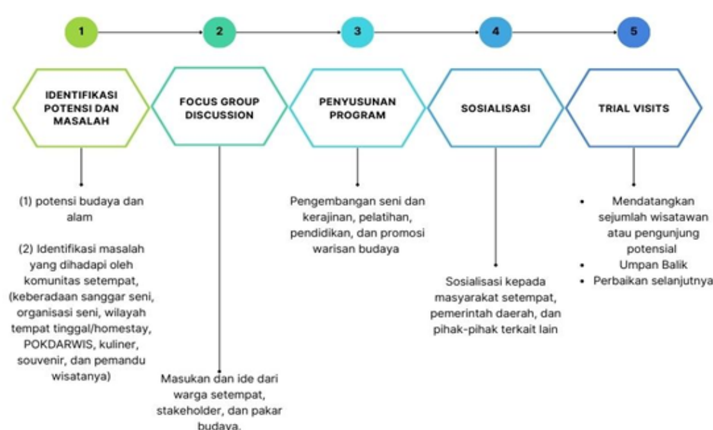
Pelestarian Seni Dan Budaya Melalui Pembentukan Kampung Eduwisata Mentaraman Malang Jawa Timur

Tahapan yang digunakan identifikasi potensi dan masalah, FGD, penyusunan program, sosialisasi, dan trial visits. Analisis hasil digunakan tahapan simultan 6P.